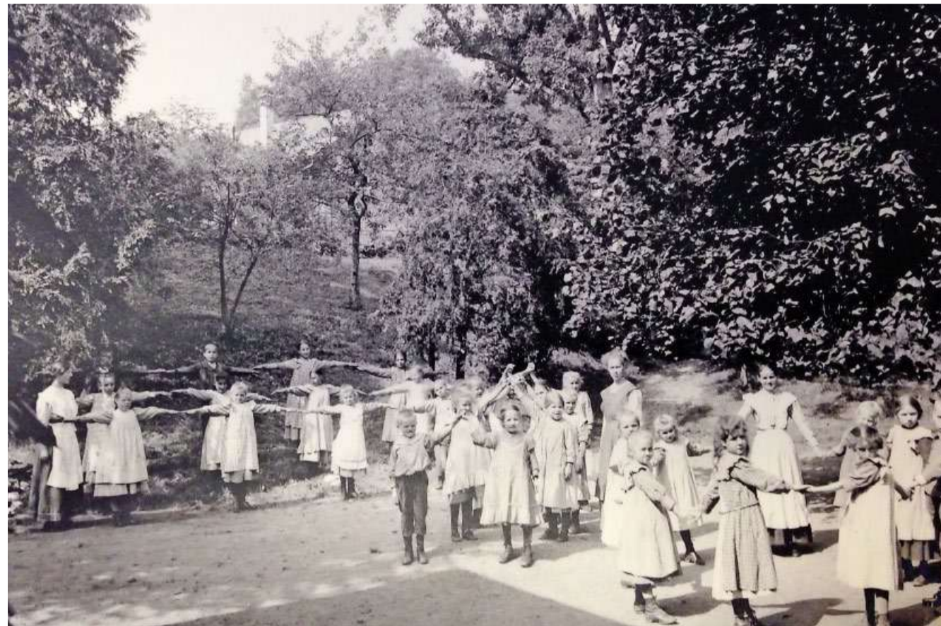
Archivbild um 1910

1868 wurde es als «Erziehungs- und Pflegeanstalt für geistesschwache Kinder» eröffnet. 150 Jahre später ist das Berner Weissenheim eine heilpädagogische Schule mit fortschrittlichem Konzept - aber auch mit einem schwierigen historischen Erbe. (mob) – Seite 21