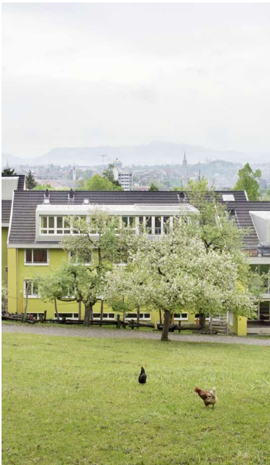
Das heilpädagogische Schulheim Weissenheim.

Locher kam via Staatsarchiv mit der älteren Frau in Kontakt. Er besuchte sie, schrieb ihre Geschichte auf, half ihr, das Gesuch für den Bundesbeitrag auszufül-