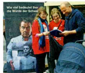
5. April, Bern: Startschuss zur Unterschriftensammlung

Bis heute leiden Tausende von Frauen und Männern darunter, dass sie von den Behörden unter dem Titel «fürsorgerische Zwangsmassnahmen» verdingt, gegen ihren Willen sterilisiert und weggesperrt wurden. Ein überparteiliches Komitee kämpft nun gemeinsam mit dem Beobachter für deren Rehabilitation. Die Anfang April lancierte Volksinitiative fordert für die Betroffenen