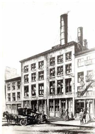
Das Kraftwerk Pearl Street in New York, erbaut 1882

Für die erste Lichtanlage auf dem Dampfer «Columbia» baute Krüsi den Dynamo. Beim Bau des Pearl-Street-Kraftwerks in New York verlegte Krüsi die ersten unterirdischen Elektrokabel.