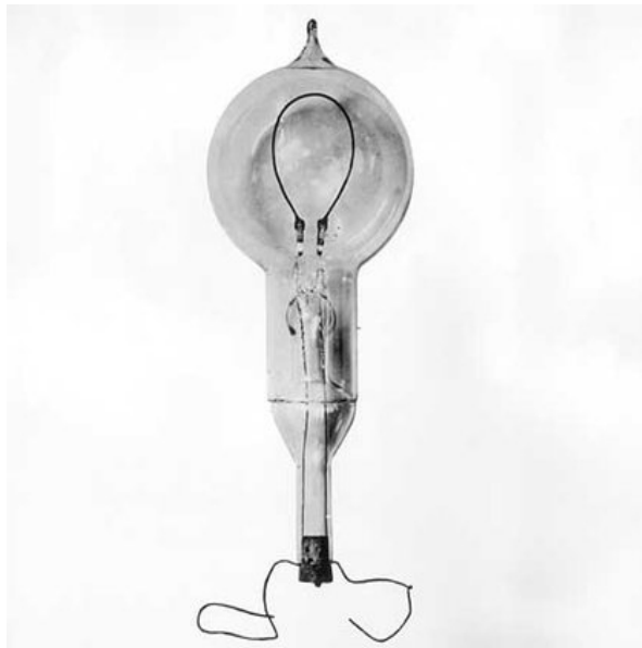
Die erste Glühlampe, erfunden im Jahr 1880

Für die erste Lichtanlage auf dem Dampfer «Columbia» baute Krüsi den Dynamo. Beim Bau des Pearl-Street-Kraftwerks in New York verlegte Krüsi die ersten unterirdischen Elektrokabel.